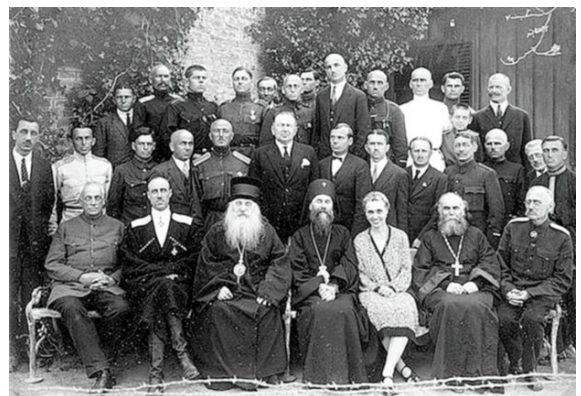
ruska izbjeglička elita